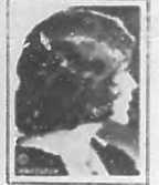
MAY MURRAY Focoma Escrifa del Cine.