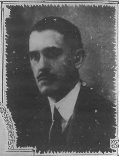
RAMON GRAU SAN MARTIN El eminente cirujano, que días pasados hizo su ingreso en la Academia de Ciencias.

sos al monte que rodeaba la laguna del Masío. Más tarde, cuando joven, en Madrid buscaba las aguas del Estanque del Retiro, porque parecíanme mayores que las del Manzanares; en París recorría las orillas del Sena o las pintorescas de los lagos del Bois de Boulogne, y en Lyon contemplaba correr bajo los puentes unas veces al Saona y otras al Ródano. Recientemente, en Washington, ya en plena edad viril, paseaba por las hermosas orillas del Potomac, sin encontrar ni entonces ni ahora los encantos del mar. De ese mar fosforescente como el Mediterráneo, agitado como el Cantábrico o tranquilo como el Caribe. De ese mar que encierra en sus profundidades secretos de tragedias humanas, ruinas de continentes sumergidos, como la Atlántida, y preciosidades de la vida animal y vegetal, que con su maravilloso poder narrativo nos hiciera contemplar Julio