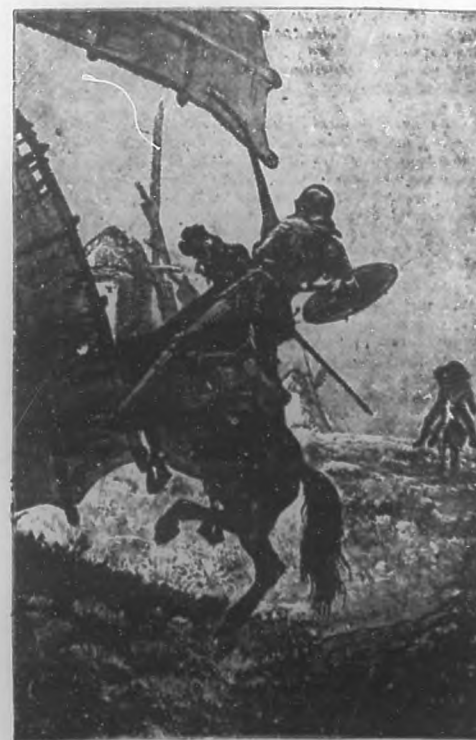
LA AVENTURA DE LOS MOLINOS (Bella ilustración tomada en una de las más populares ediciones del “Quijote”).

Artículo 3.—Los infractores de esta Ley incurrirán en una multa de cincuenta balboas por cada día que un anuncio o rótulo, ni escrito ni grabado, permanezca a la vista del pú-