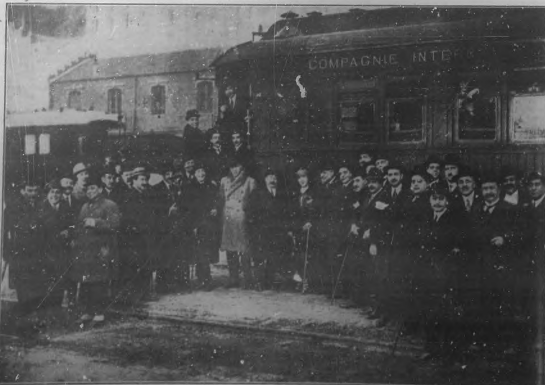
Personajes que asistieron al original homenaje tributado al insigne escritor Sr. Eduardo Zamacois, con motivo del éxito de su novela "Memorias de un vagón de ferrocarril."