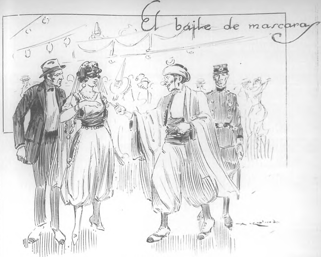
POR VICENTE PARDO SUAREZ