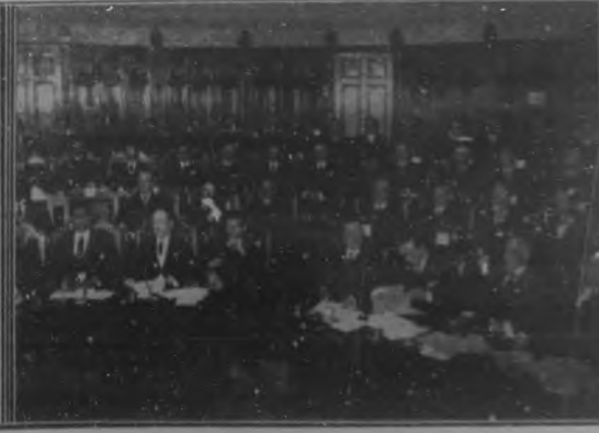
EL CONGRESO PAN-AMERICANO DE CHILE.—A la izquierda:—El Presidente de la República de Chile con su Consejo de Ministros, a la salida del Congreso el día de la sesión inaugural.—A la derecha:—Un aspecto del Salón donde se celebra el Congreso, durante una de las sesiones.